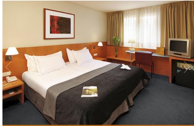
HOTEL ST. GERVASI BARCELONA Habitación estándar, 01