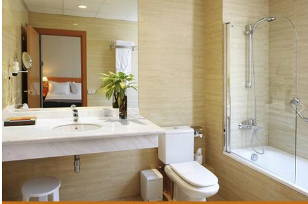
HOTEL ST. GERVASI BARCELONA Baño