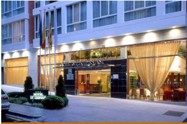
HOTEL ST. GERVASI BARCELONA Fachada