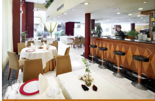
HOTEL ST. GERVASI BARCELONA Restaurante & Cafeteria